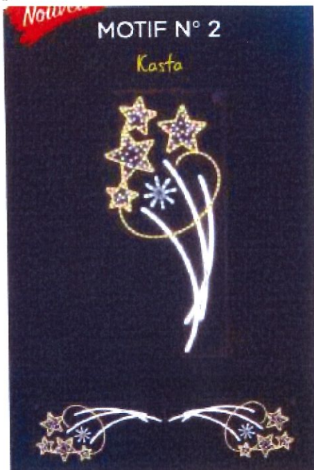
Motif « KASTA » hauteur 2 m, largeur 0.90 m : 396 € ht